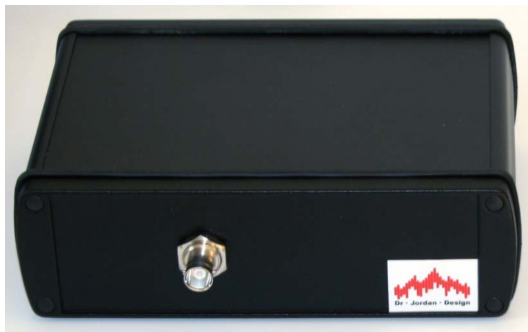
ICP-Messinterface zum Anschluss von ICP-Mikrofonen an einen PC über USB. Die analoge Bandbreite beträgt 96kHz. Das System verfügt über eine USB Anschluss und eine BNC-Buchse für das Mikrofon.